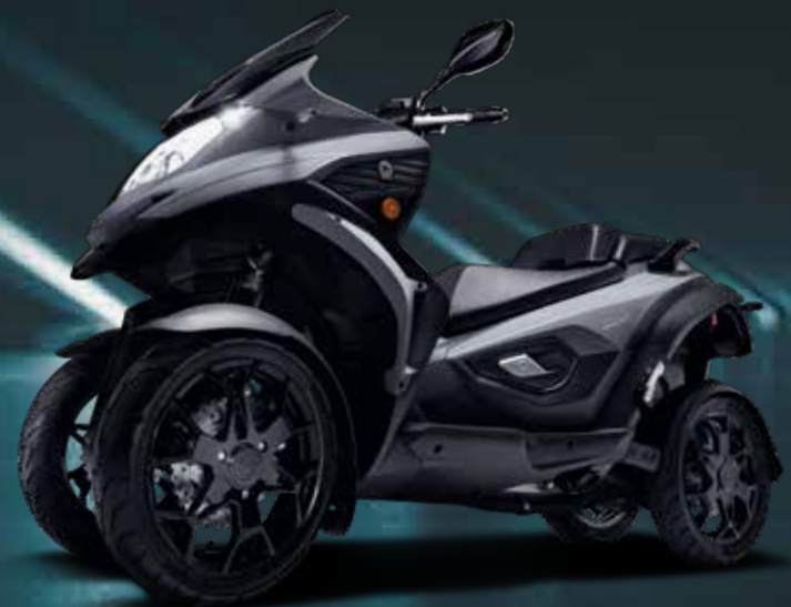
TITANIUM GREY (MATT)